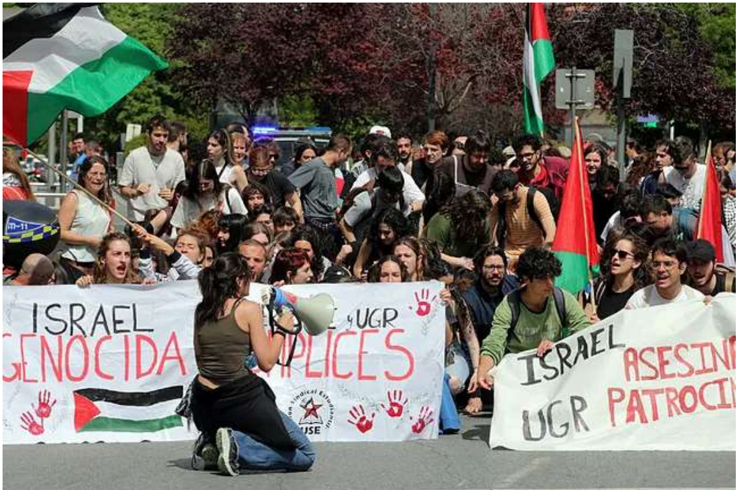
Universitarios de Granada se manifiestan, este jueves, por la ruptura de relaciones con Israel.