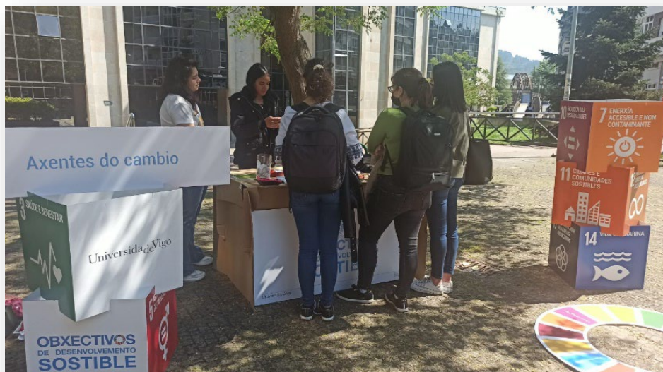
Imaxe do posto informativo no Campus Ourense, abril 2022

O voluntariado Axenda 2030: Axentes do cambio é un programa propio da Universidade de Vigo impulsado pola Vicerreitoría de Benestar Equidade e Diversidade. +Info