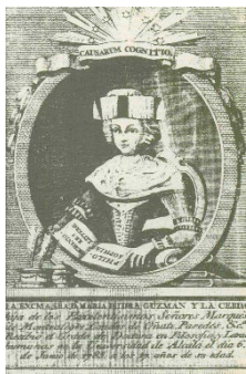
María Isidra de Guzmán, primeira doutorada española