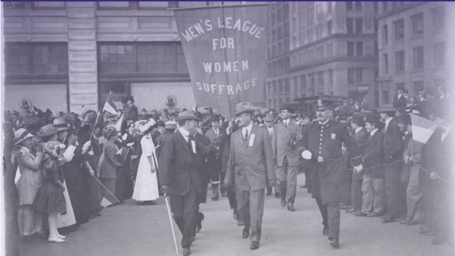
Marcha de homes polo sufraxio feminino en Nova York.

Publicación mensual da Unidade de Igualdade