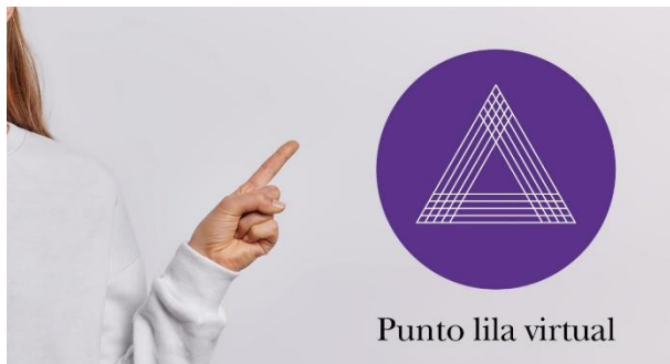
Imaxe do Punto lila virtual dispoñible no espazo web da Unidade de Igualdade en galego e inglés.

Recursos contra as violencias machistas da UVigo +Info