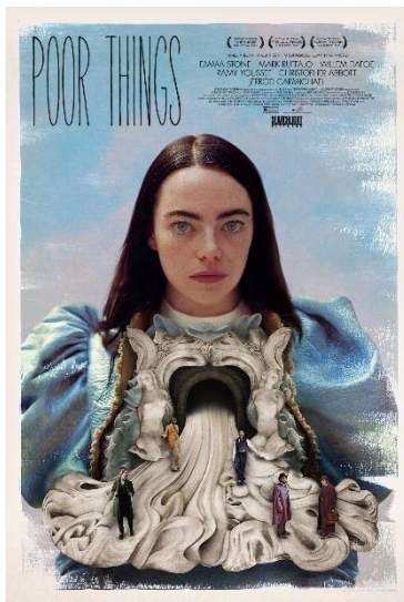
Poor things (Yorgos Lanthimos, 2023)

O día 11 de marzo celebrouse a Cerimonia dos Oscar. Un dos filmes galardoados foi Poor Things , co premio a mellor actriz para Emma Stone (entre outros) e numerosas nominacións, como a mellor dirección e mellor película. A obra, dirixida por Yorgos Lanthimos e baseada nunha novela de Alasdair Gray, conta a historia de Bella Baxter, unha muller á que un científico trae de volta á vida coa idade mental dun neonato. Tamén Barbie (Greta Gerwing, 2023) deu moito que falar, aínda que pola súa escasa presenza nos premios. Ao igual que Poor things , trata temas relacionados coa mirada masculina, a idealización e o control sobre o aspecto e o comportamento das mulleres.