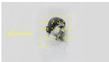
Hellen Keller, a muller marabilla? (Grupo Chévere. 2024)

A obra de teatro Hellen Keller ¿a muller marabilla? do grupo Chévere, recrea a vida da primeira muller xordocega que se graduou en 1904 en Harvard, enfatizando a intelixencia, o compromiso político e o activismo sufragista desta muller, fronte o retrato “clásico” de Hollywood quen, na película O milagro de Ana Sullivan (1962) reforza o estereotipo do pígmalión, un modelo educativo unidireccional e pasivo.