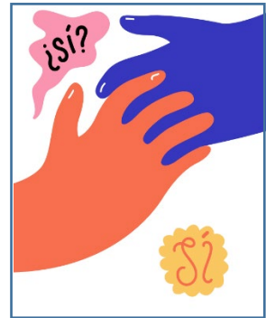
Ilustración do fanzine sobre consentimento do Instituto de Canarias

As testemuñas en liña , como eGarante , permiten certificar gratuitamente o contido dunha web concreta nun momento determinado, ou o envío dun correo electrónico ou unha mensaxe a unha persoa específica. Estas ferramentas utilizan de firmas dixitais para acreditar de maneira inequívoca unha proba. Desta forma, calquera clase de proba tomada permitirá acreditar a súa integridade, ao contrario do que sucede coas capturas de pantalla ou calquera outro método similar no que non intervén unha entidade de confianza, e que non permiten demostrar a súa autenticidade, xa que puideron ser manipuladas.